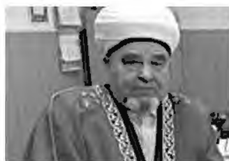
муфтий Савбян Сулейманов , Председатель РДУМ Ульяновской области ЦДУМ России