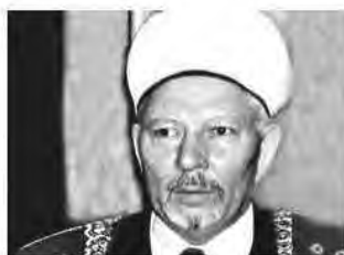
муфтий Жафяр Пончаев , Председатель РДУМ Северо- Западного региона ЦДУМ России; Главный заместитель Верховного муфтия

назначены шейхуль-Исламом, Верховным муфтием, председателем ЦДУМ России: