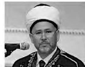
муфтий Равиль Мамлеев , Председатель РДУМ Свердловской области ЦДУМ России

назначены шейхуль-Исламом, Верховным муфтием, председателем ЦДУМ России: