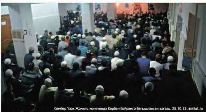
Сенбер Узак Жамияг мочетиде Корбан Байрамга багышланган вагаз. 25.10.12, simtat.ru