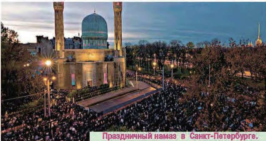
Праздничный намаз в Санкт-Петербурге.