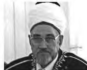
муфтий Вагиз Яруллин , РДУМ Самарской области ЦДУМ России; Главный казый ЦДУМ России