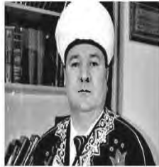
муфтий Хайдар Хафизов, РДУМ ЯНАО ЦДУМ России