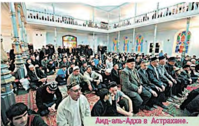
Аид-аль-Адха в Астрахани.