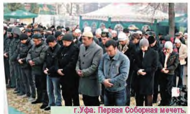
г.Уфа. Первая Соборная мечеть.

Уважаемые читатели! Отнеситесь с почтением к газете, не используйте ее в недостойных целях,