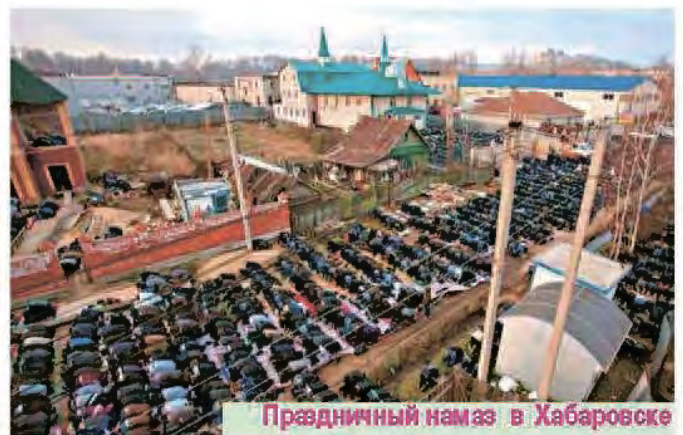
Праздничный намаз в Хабаровске