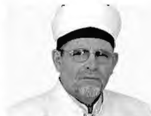
муфтий Зулькарнай Шакирзянов , Председатель Омского муфтията