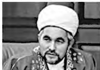
муфтий Ринат Раев , Председатель РДУМ Челябинской и Курганской областей ЦДУМ, ректор РИУ ЦДУМ России; заместитель председателя ЦДУМ по образованию и подготовке кадров