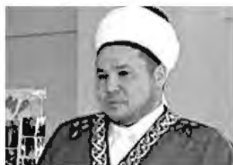
муфтий Фануз Салимгареев , Председатель РДУМ Республики Марий-Эл ЦДУМ России