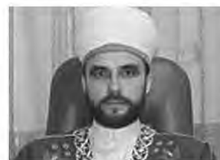
муфтий Фаиз Мухамедшин Председатель РДУМ Республики Удмуртия ЦДУМ России