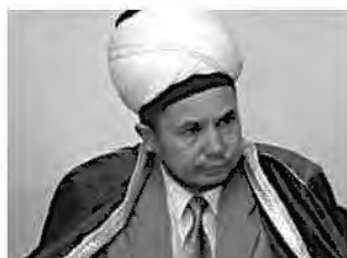
муфтий Абдульбарий Хайруллин , Председатель РДУМ Оренбургской области ЦДУМ России