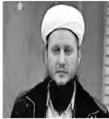
муфтий Ильяс Биктимиров, Председатель РДУМ Волгоградской области ЦДУМ России