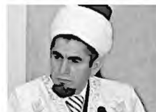
муфтий Заки Айзатуллин , Председатель РДУМ Республики Мордовия ЦДУМ России