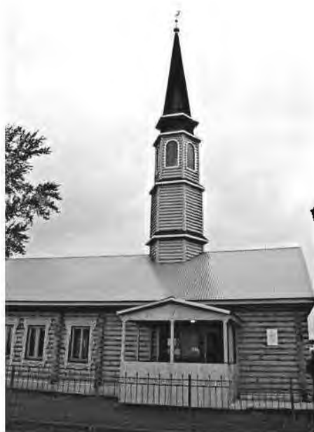
В деревне Нижнеманчарово Илишевского района 8 сентября распахнула свои двери для верующих мусульман мечеть