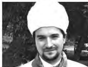
муфтий Мухаммад Таджуддинов , Председатель РДУМ РБ ЦДУМ России, руководитель Администрации; заместитель председателя ЦДУМ