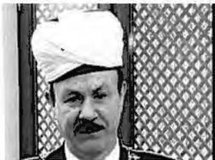
муфтий Джафяр Бикмаев , Председатель РДУМ Ростовской области ЦДУМ России; Главный заместитель Верховного муфтия