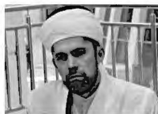
Ильдар Сафиуллин , 1-ый заместитель Председателя РДУМ Ульяновской области ЦДУМ России