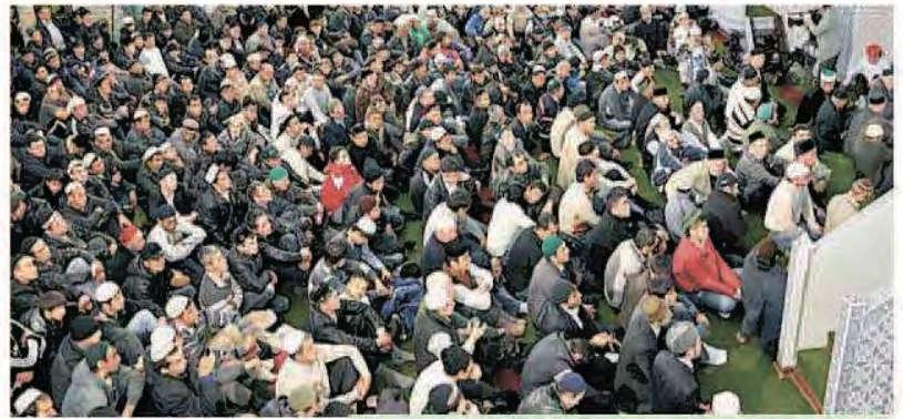
г.Уфа. Мечеть "Ляля-Тюльпан"